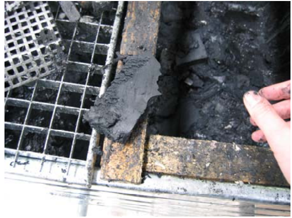
Schlamm aus Separator A-25 spatentrockener, stichfester Lackschlamm