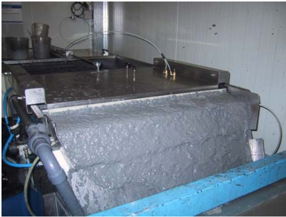
Herkömmlicher Oberflächenräumer Lackschlamm mit hoher Restfeuchte

kosten gespart werden, darüber hinaus kann auf den Einsatz von Flockungsmittel verzichtet werden. Bezogen auf die Lackeinsatzmenge werden in den Kabinen mit dem kombinierten Einsatz von Lösemittel- und Wasserlacken ca. 16-20% Koagulieremittel eingesetzt. Auch die Reduzierung von Anlagenstörungen und Stillstandszeiten führen dazu, dass sich die Zentrifugen innerhalb von ca. 1 – 1,5 Jahren amortisieren konnten.